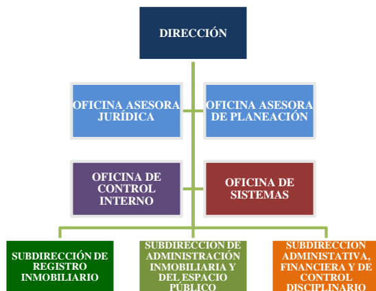
Gráfico No. 1 Estructura Funcional

El Departamento, cuenta con un equipo de servidores de planta y contratistas con excelentes condiciones técnicas y humanas que en desarrollo de sus funciones y objetos contractuales, ponen a disposición de la Entidad y de la ciudadanía, todo su potencial de gestión enmarcado por